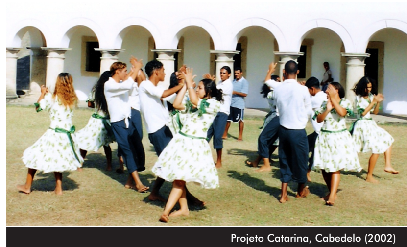
Projeto Catarina, Cabedelo (2002)