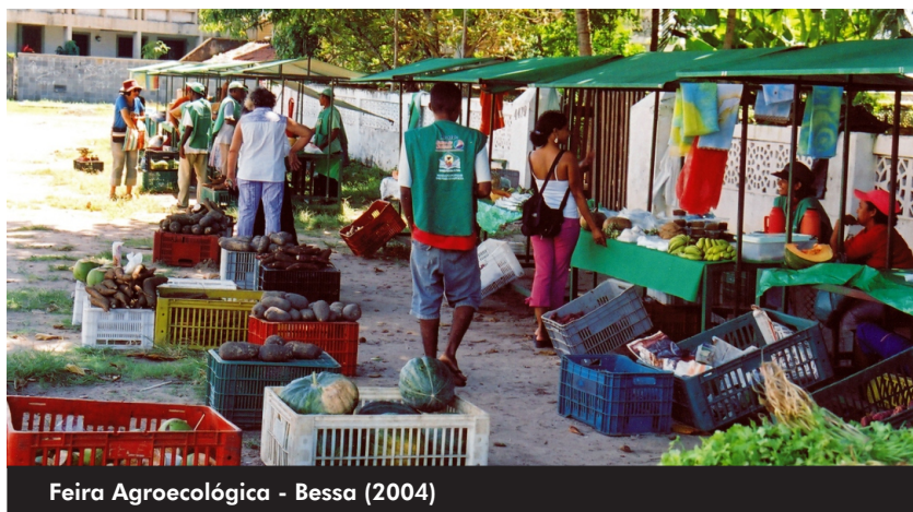
Feira Agroecológica - Bessa (2004)