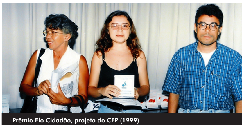
Prêmio Elo Cidadão, projeto do CFP (1999)