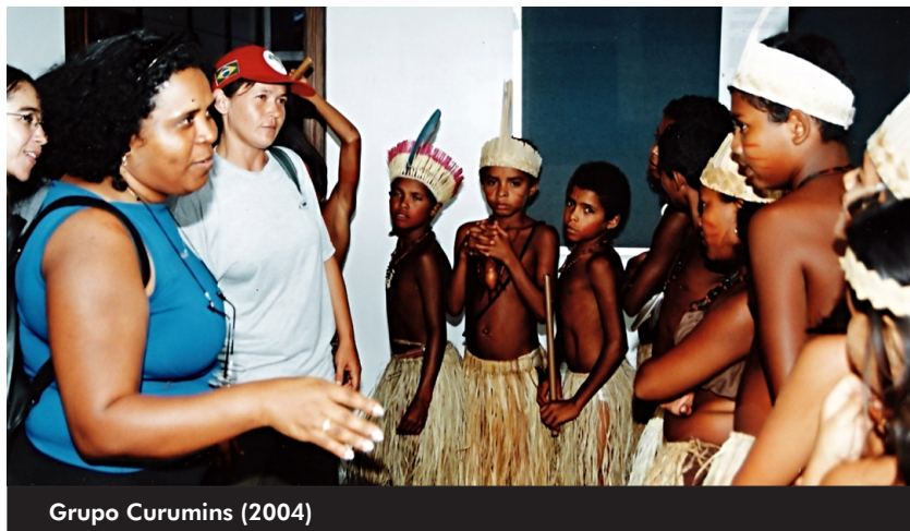
Grupo Curumins (2004)