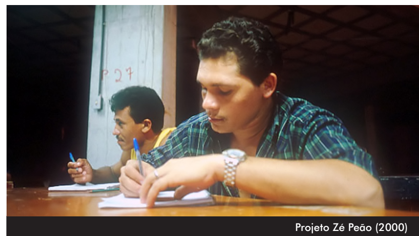
Projeto Zé Peão (2000)