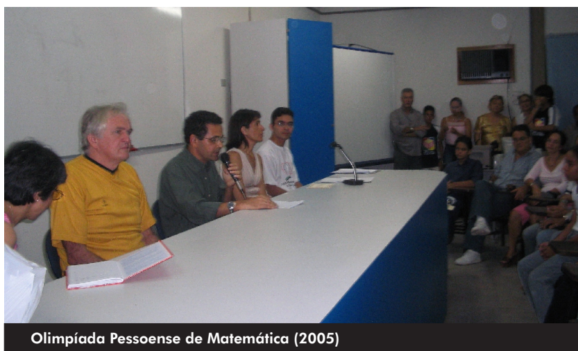
Olimpíada Pessoense de Matemática (2005)

cursos da área de Saúde - Medicina, Odontologia, Farmácia, Enfermagem, Nutrição e Fisioterapia. O ERI foi criado visando favorecer a integração entre o aparelho formador e os serviços de saúde, com a implementação dos programas de extensão e de cobertura de assistência primária à população. Tem funcionado ininterruptamente, inicialmente associado ao Programa de Interiorização das Ações de Saúde e Saneamento - PIASS e atualmente ao Sistema Único de Saúde - SUS. O ERI tem convênio com nove prefeituras municipais. Ainda na área de Saúde, o Programa Interdisciplinar de Ação Comunitária da PRAC, junto com a Direção Executiva Nacional de Estudantes de Medicina - DENEM, os Centros e Diretórios Acadêmicos e a AGEMTE (Assessoria de Grupo Especializada Multidisciplinar em Tecnologia e Extensão) vem desenvolvendo, desde 2000, o Estágio de Vivência em Comunidades, buscando alternativas para a melhoria da qualidade de vida com metodologias participativas. Ao mesmo tempo, a inserção dos estudantes nas comunidades tem favorecido a melhoria da qualidade do ensino de graduação. Recentemente o Ministério da Saúde criou o Programa VER-SUS EXTENSÃO para apoiar Estágios Regionais Inter-profissionais e Vivências em Educação Popular no SUS, no qual os dois programas da UFPB estão contemplados.