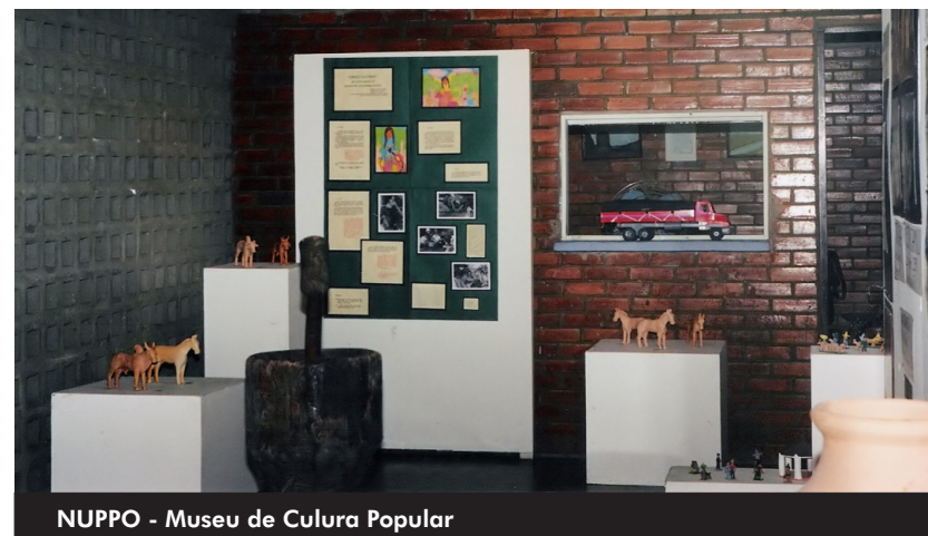
NUPPO - Museu de Culura Popular