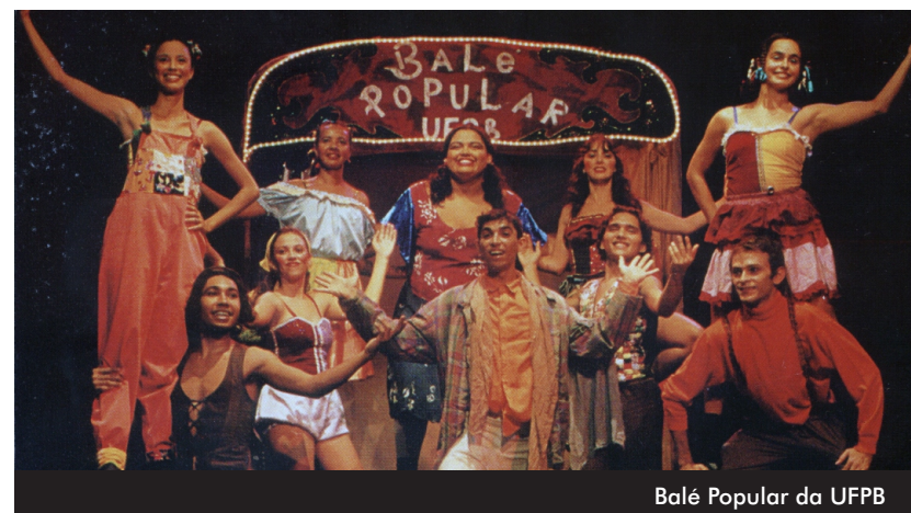
Balé Popular da UFPB

O Estágio Rural Integrado está regulamentado pelas Resoluções nº 284/1979 do CONSUNI e nº 09/1979 do CONSEPE, como atividade obrigatória para os concluintes dos