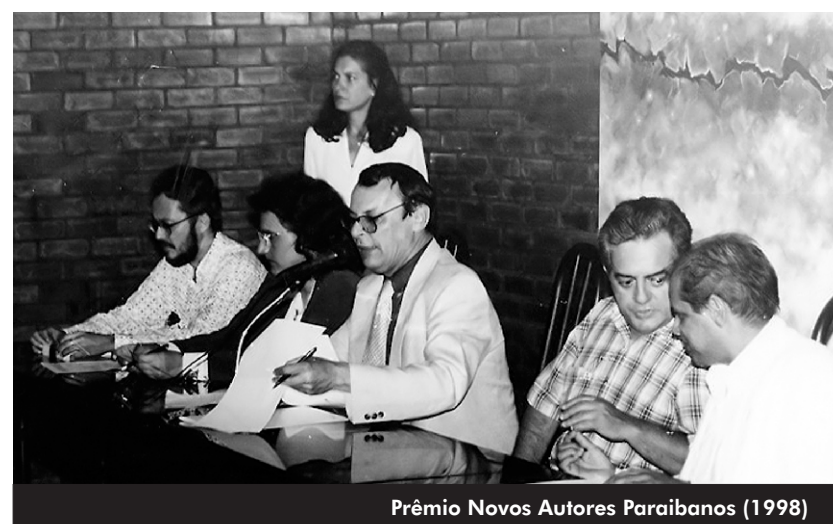
Prêmio Novos Autores Paraibanos (1998)