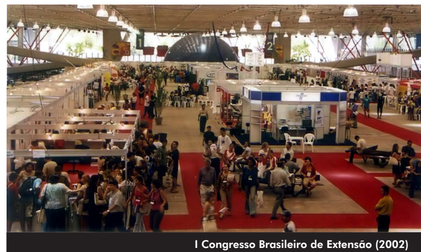
I Congresso Brasileiro de Extensão (2002)