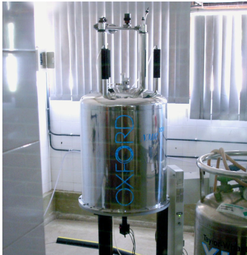
Ressonância magnética (2005)