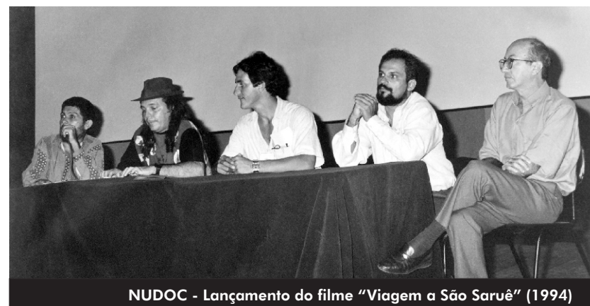
NUDOC - Lançamento do filme "Viagem a São Saruê" (1994)