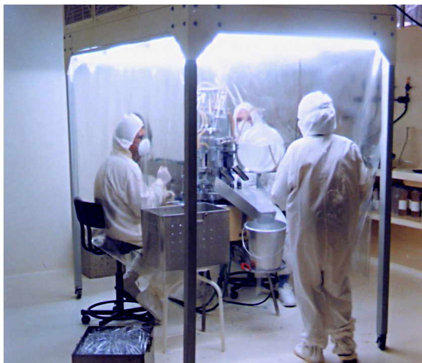
Máquina de ressonância magnética Nuclear (2005)