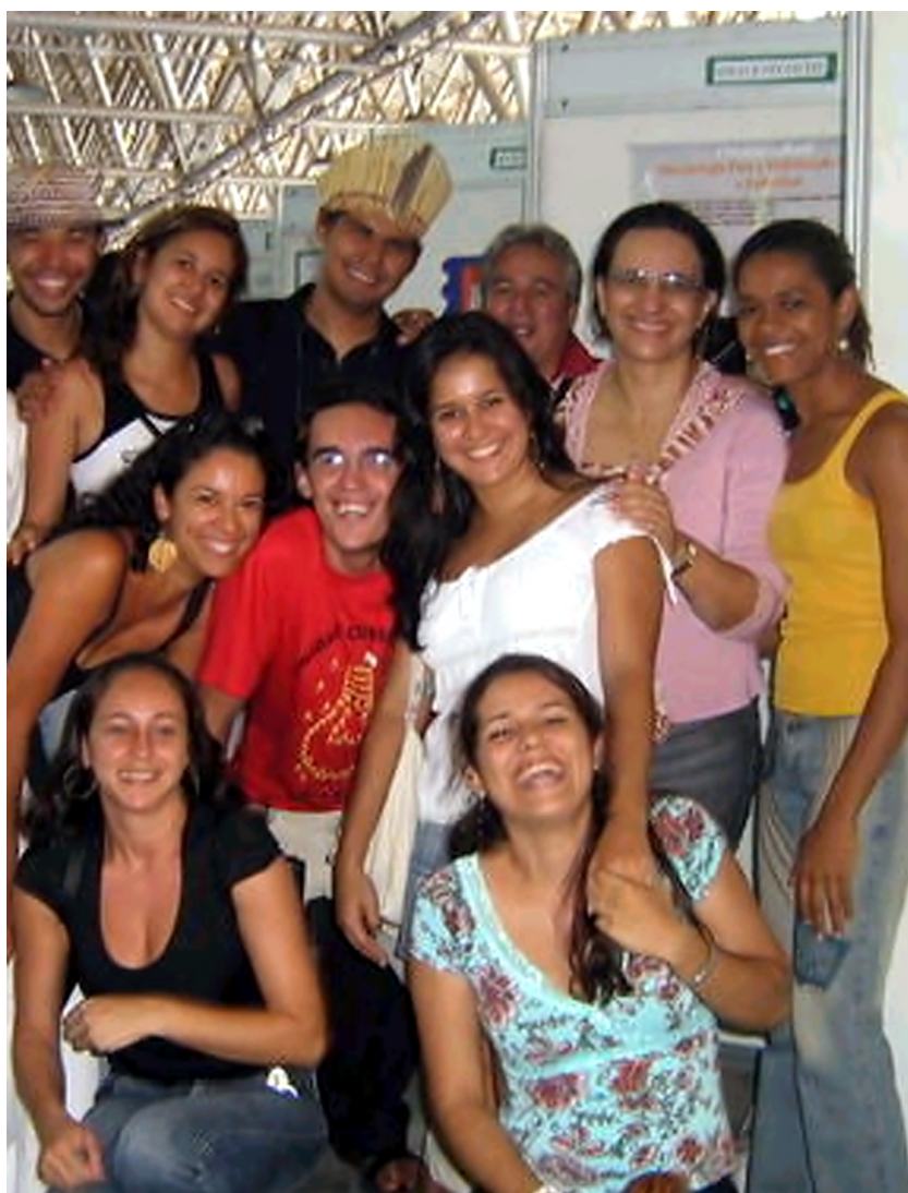
Equipe do Estágio de Vivência em Comunidade (2005)

Informe, para divulgação das atividades das IES.