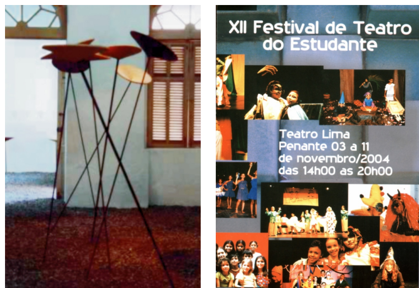
NAC - Exposição A flor da pele (2000) e NTU - Festival de Teatro (2004)