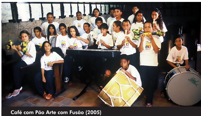
Café com Pão Arte com Fusão (2005)