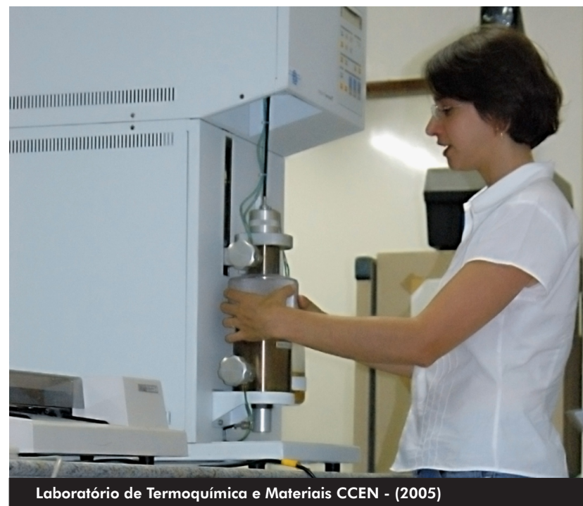
Laboratório de Termoquímica e Materiais CCEN - (2005)

Aos seus 50 anos, uma "senhora madura", a UFPB deve empreender um profundo processo de auto-reflexão sobre sua trajetória, os caminhos percorridos, seus atalhos e desvios, porque uma duração tem muitas vidas, umas mais maduras, outras menos, porque a vida da gente e da Instituição - afinal, esta é feita de pessoas de carne e osso - é um constante nascer - amadurecer-envelhecer, renascer, não em sentido progressivo linear, mas cruzamento contraditório entre seus vários ritmos. Mas, se quiser ser permanente, não existir por existir, mas persistir como relevância social, toda instituição - quanto mais uma Universidade! - tem que se reexaminar historicamente, revolver criticamente seu passado e seu presente, visando abrir novas searas para o futuro. Para outros 50 anos e, quiçá, muito mais que isso.