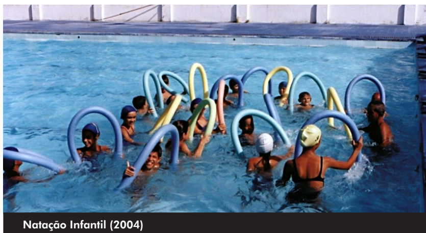
Natação Infantil (2004)