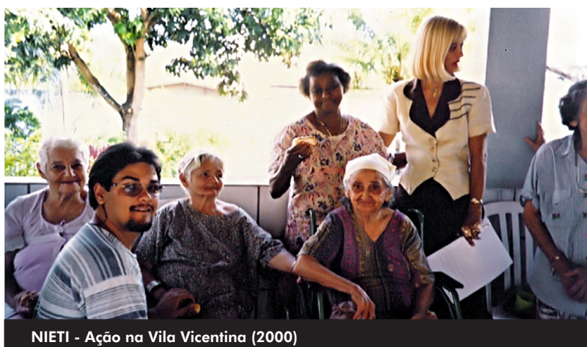
NIETI - Ação na Vila Vicentina (2000)