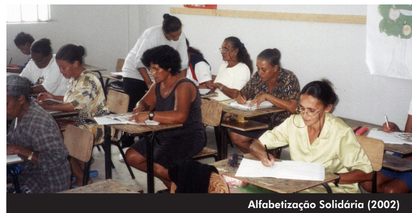
Alfabetização Solidária (2002)

Cada vez se reforça o caminho das propostas estruturantes e participativas, considerando-se prioritariamente três itens: a extensão como componente curricular que prima pela interdisciplinaridade e a indissociabilidade com o ensino e a pesquisa; as comunidades nas quais a Universidade atua não como clientela ou público-alvo, mas como sujeito ativo e colaborativo da ação extensionista; e a compreensão da missão social da Universidade na sua inter-relação com os órgãos de governo responsáveis pela implementação das políticas públicas voltadas para a transformação da sociedade brasileira