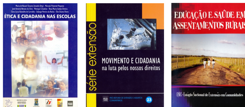
Publicações da Extensão