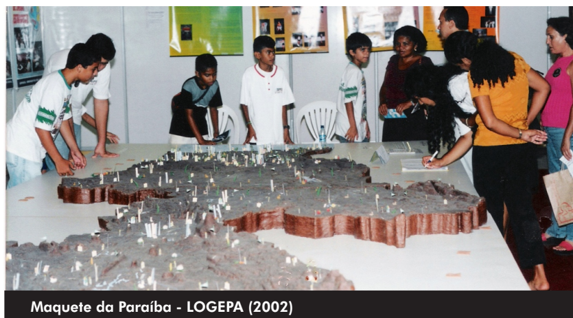
Maquete da Paraíba - LOGEPA (2002)