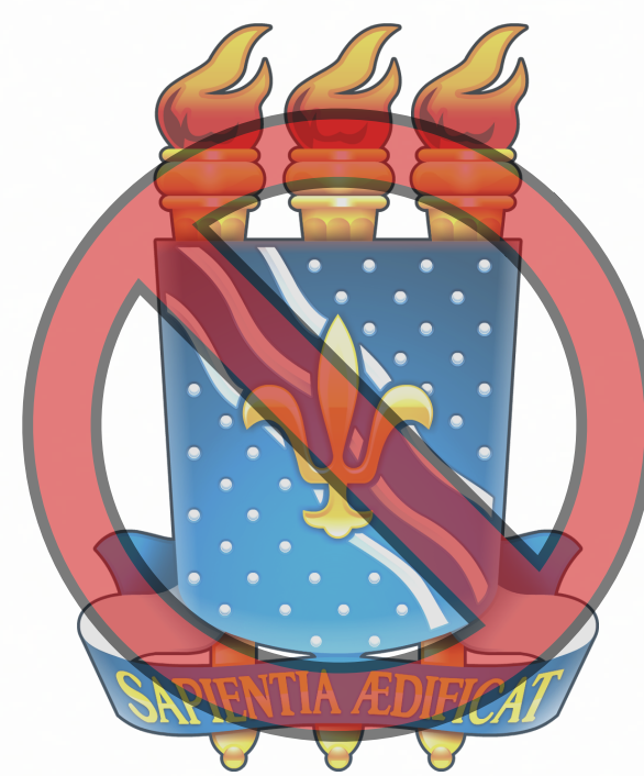
MODIFICAR AS CORES